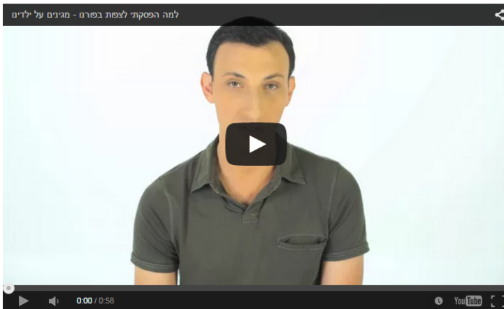
למה הפסקת לצפות בפרג - מינים על ילדים

האם 'הסיפור שאינו נגמר' עדיין רלוונטי לדור הוונטאפ? נלי אייקוביץ | 10