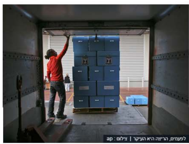
לפעמים, הריצה היא העיקר

איילת רוזן | mako | פורסם 18:35 05/03/15